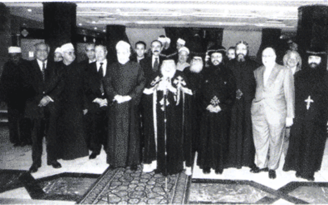
في مشيخة الأزهر : مع فضيلة الأمام الأكبر شيخ الأزهر ورجاله