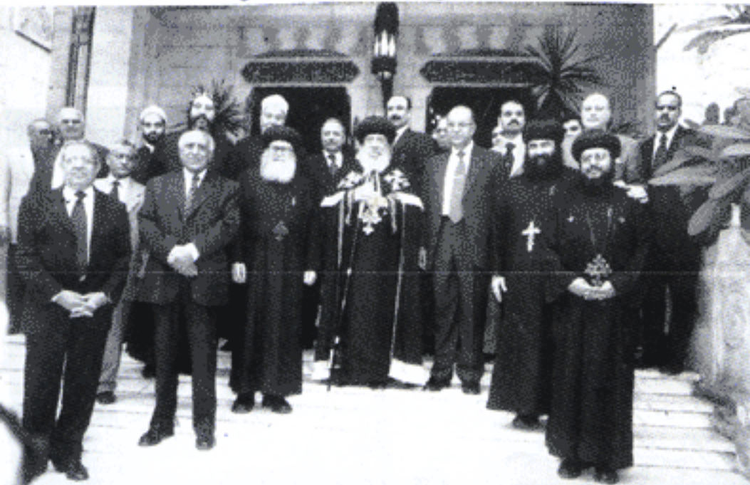
في وزارة الأوقاف : مع فضيلة وزير الأوقاف د. حمدي زقزوق

إن الأعياد فرصة جميلة للتلاقى. وبمناسبة عيد الفطر، اتفق على أن يكون يوم الخميس فترة تهنئ فيها الكنيسة أختوتنا المسلمين، ممثلين في قياداتهم الدينية، مع تهنئة رجال الدولة في شخص الرئيس حسنى مبارك.